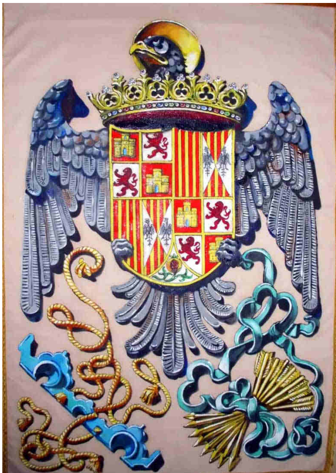
Blason de los reyes catolicos, oleo sobre lienzo, cm 160x110

Tenemos el gusto de invitarlos a la inauguración Sabado, 7 de Julio de 2018, 18.30 h.