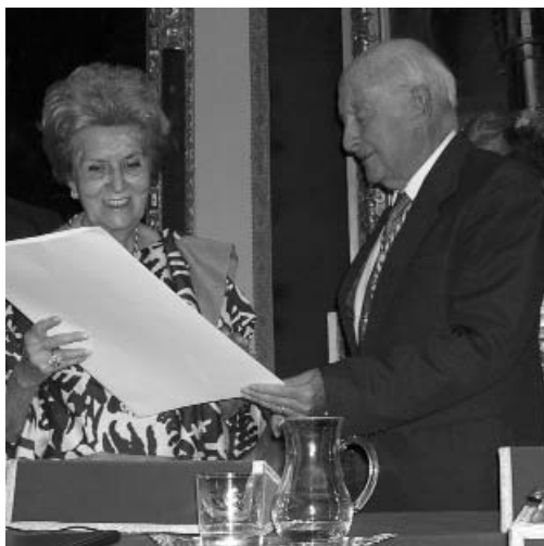
Los nuevos Académicos en un momento de sus respectivas ceremonias