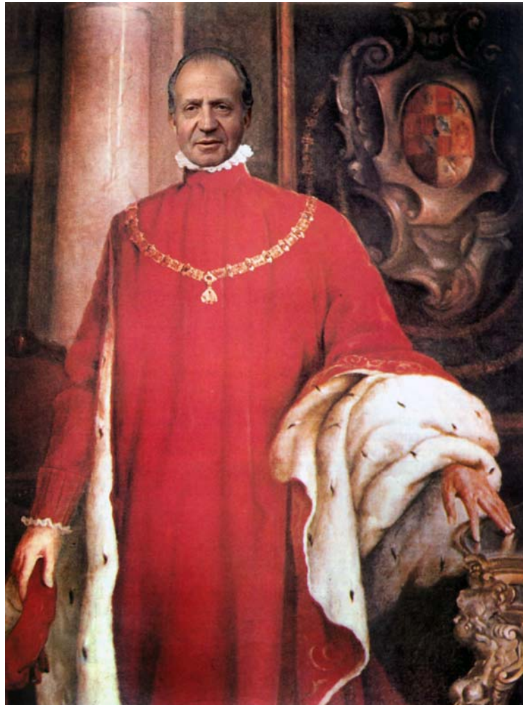
Fotomontaje de S.M. el Rey Don Juan Carlos como Gran Maestro de la Orden (siendo el modelo el cuadro de su abuelo Don Alfonso XIII)

Tras la abdicación el nuevo monarca, Felipe VI, se ha convertido en Jefe y Soberano de la Insigne Orden, pasando el Rey Juan Carlos a un segundo puesto como antiguo Jefe y Soberano (como aparecía Isabel II en las Guía Oficial de España durante la Restauración y hasta el momento de su muerte)