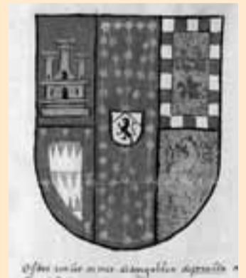
Escudo del marqués de Falces. BSB, COD.ICON. 290. FOL. 170R.FALCES