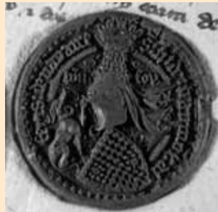
Sello de lacre, con las armas reales, de sello de cera de Charles de Beaumont, Alférez del Reino.