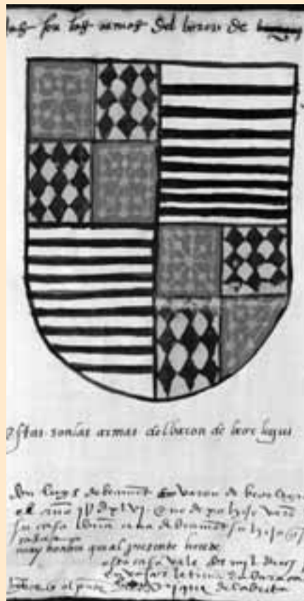
Armas del barón de Beorlegui.