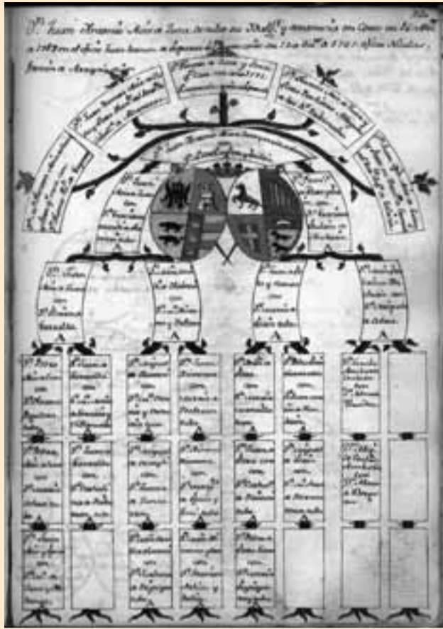
'Nobiliario' de Vicente Aoiz de Zuza. Genealogía.

Otros 32 títulos se crearon por el Reino de España