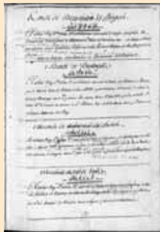
'Nobiliario' de Aoiz de Zuza.