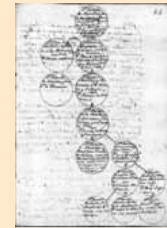
1ª línea (extinguida) de los condes de Lodosa.

"Por la Ley Paccionada de 1841 Navarra pasó de ser un reino a una provincia"