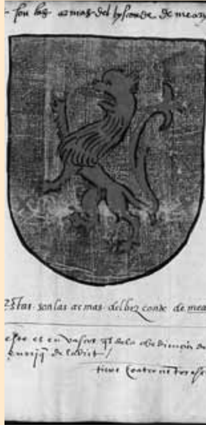
Escudo del vizconde de Méharin.