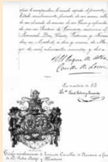
Representación de los oficios de Condestable y Canciller de Navarra en un sello de Carlos Mª Fitz-James Stuart, XVII Duque de Alba de Tormes y XVII Conde de Lerín y Condestable de Navarra. 1892

No se puede entender Navarra sin conocer las luchas entre agramonteses y beamonteses, a los condes de Javier o en qué consiste el oficio de Mariscal de Navarra. Todo eso está en la nobiliaria. También la