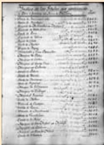
'Nobiliario' de Aoiz de Zuza. Índice.