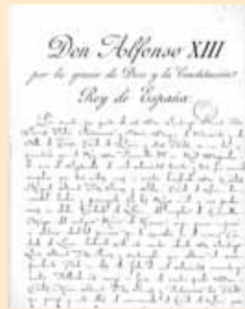
Concesión del oficio de Canciller Mayor, por parte de Alfonso XIII.