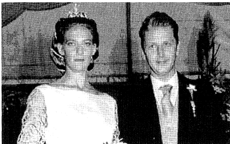
Princesa Mafalda de Saboya-Aosta el día de su boda con Don Alessandro Ruffo di Calabria, dei Principi di Palazzolo