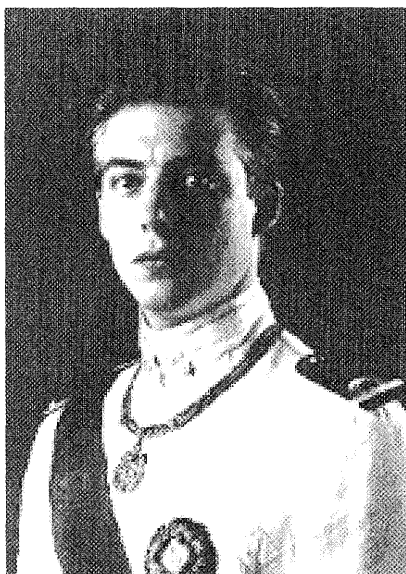
Príncipe Aimone de Saboya-Aosta, Duque delle Puglie (Apulia)