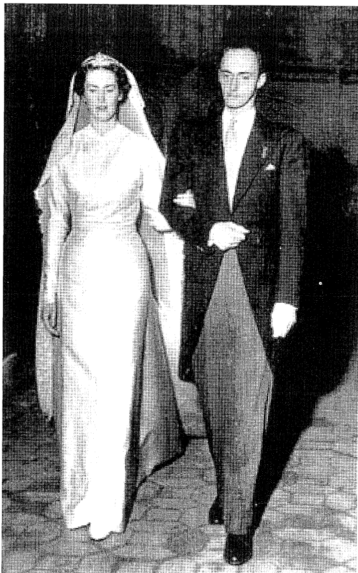
Princesa Margherita de Saboya-Aosta el día de su boda con el Archiduque Robert de Austria-Este