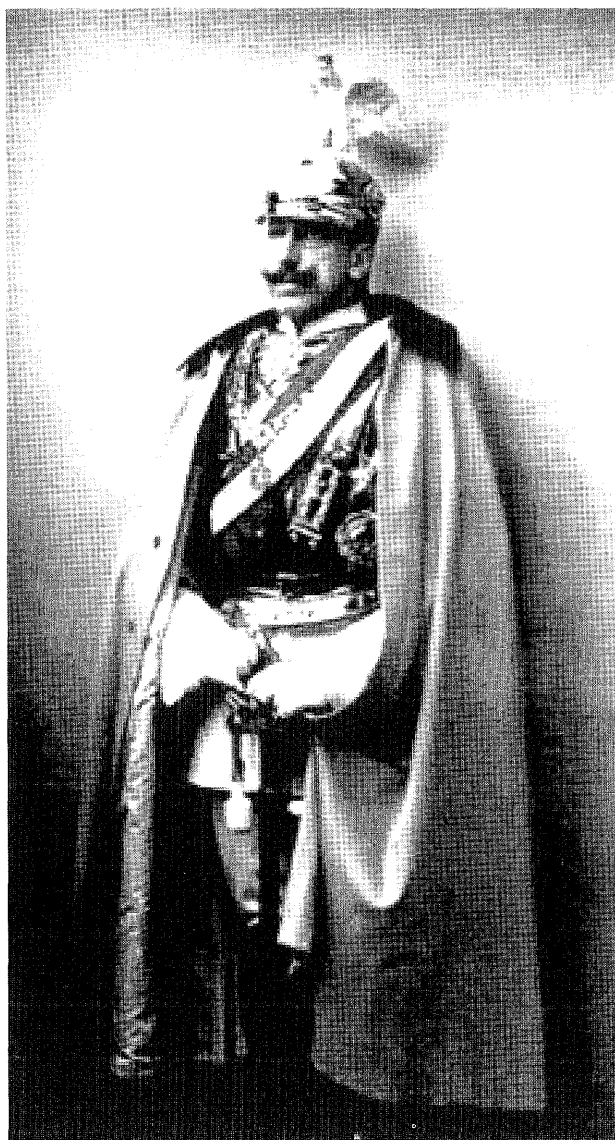
Príncipe Vittorio Emanuele de Saboya-Aosta, Conde de Torino