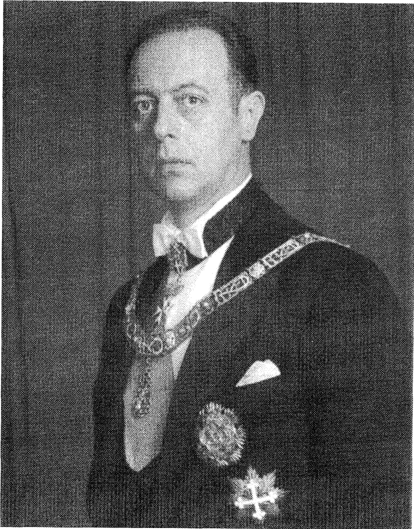
Amedeo de Saboya-Aosta, V y actual Duque de Aosta, con el Collar y Placa de la Anunziata y la Gran Cruz de la Orden de los Santos Mauricio y Lázaro