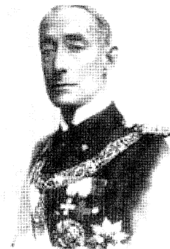
Luis Amadeo de Saboya Aosta Duque de los Abruzzos