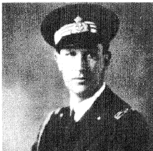
Príncipe Aimone de Saboya-Aosta, IV Duque de Aosta Rey Titular de Croacia