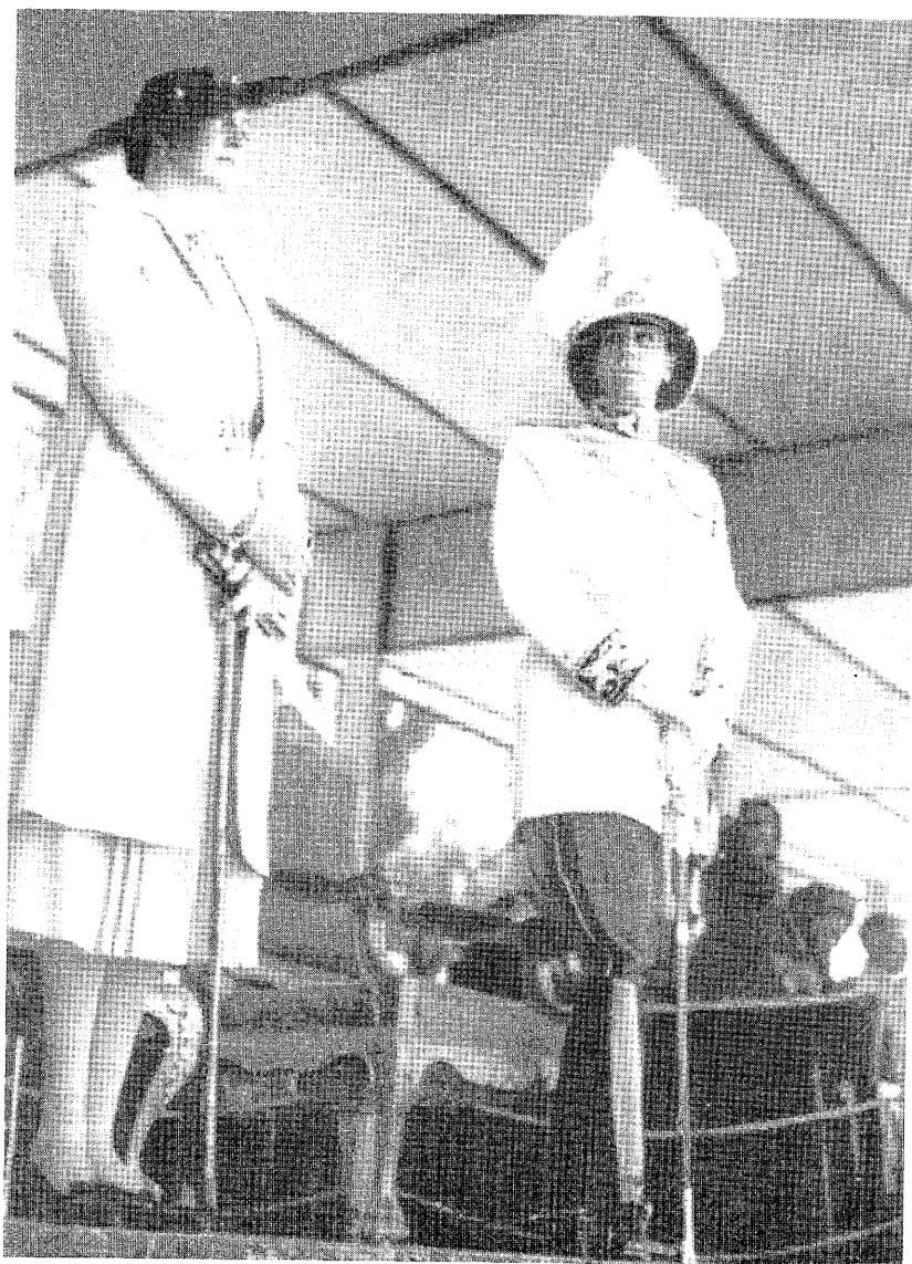
Príncipe Amedeo de Saboya-Aosta, III Duque de Aosta, con su esposa la princesa Anne de Orleans, virreyes de Etiopía