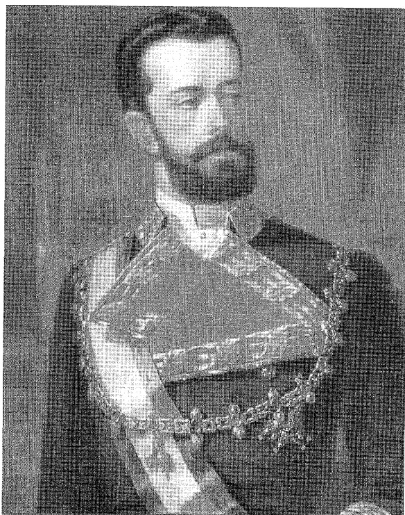
El Rey Don Amadeo con el Collar del Toisón y la Gran Cruz de Carlos III (Museo del Ejército, Madrid)