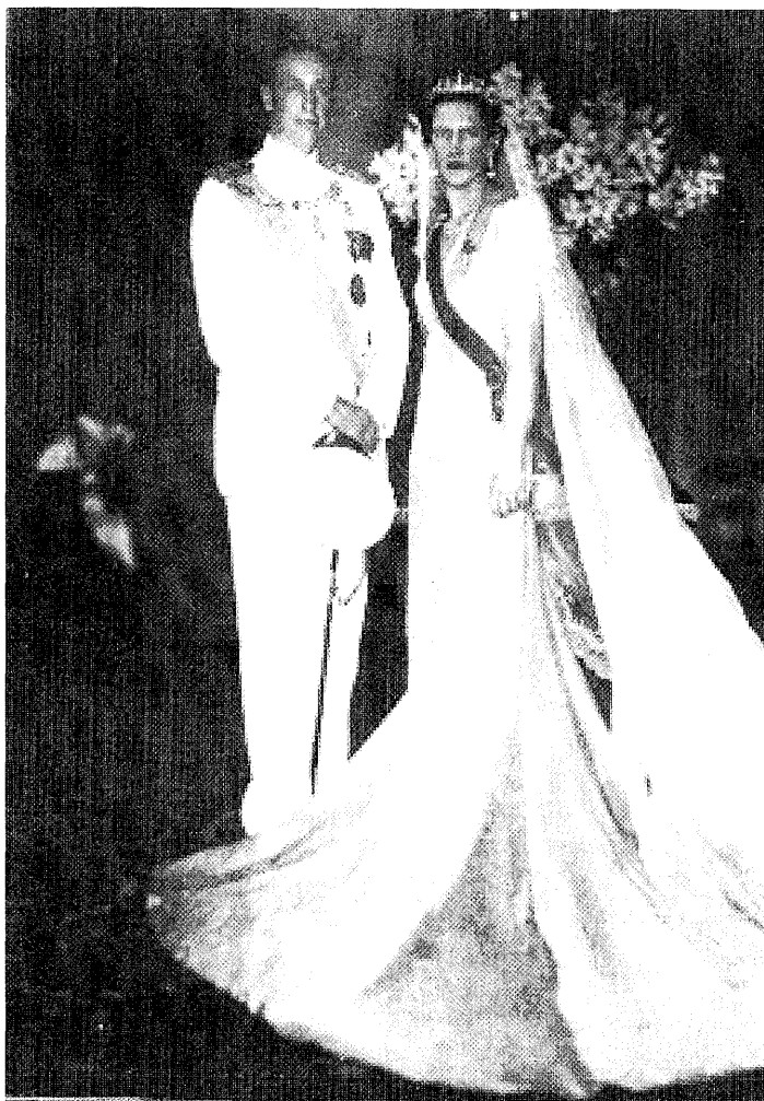
Príncipe Aimone de Saboya-Aosta, Duque de Spoleto, el día de su boda con la Princesa Irene de Grecia y Dinamarca