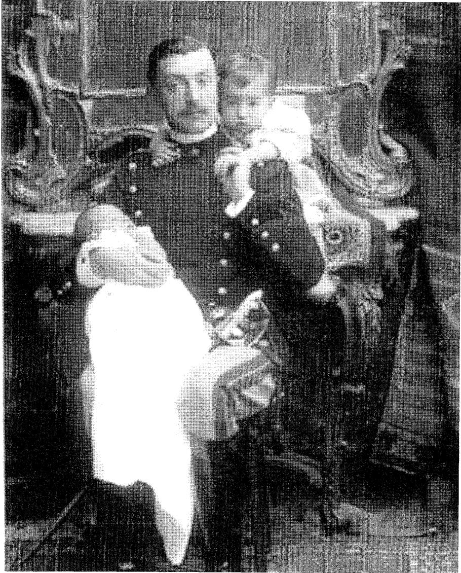
Príncipe Emanuele Filiberto de Saboya-Aosta, II Duque de Aosta, con sus hijos los príncipes Amedeo y Aimone.