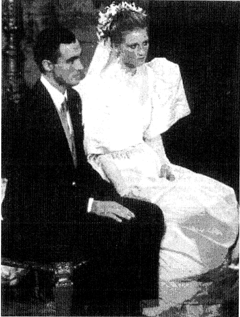
Archiduque Lorenz de Austria-Este el día de su boda con la Princesa Astrid de Bélgica.