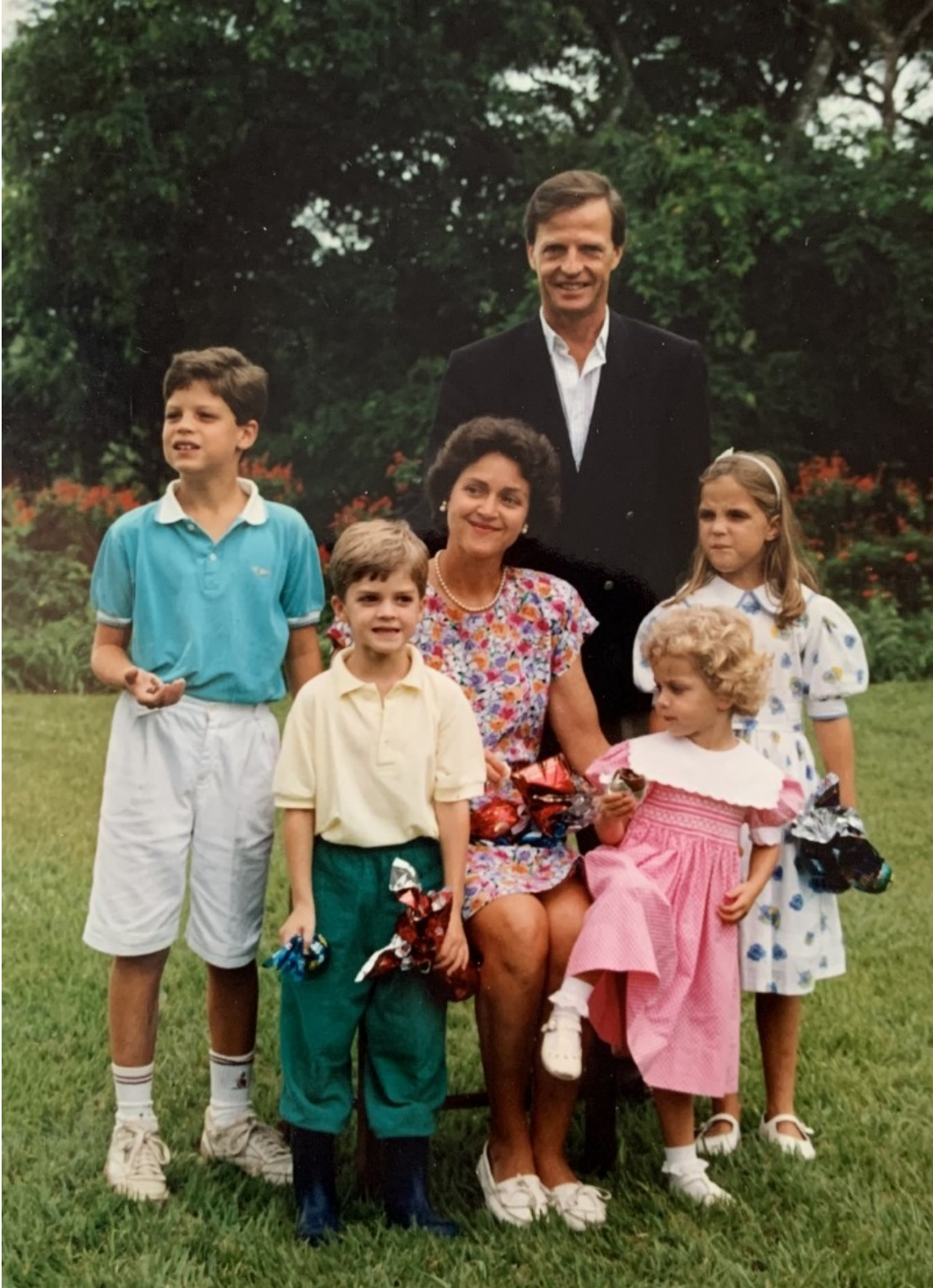
Imagen de archivo de Don Antonio y su familia en 1994.

Su Alteza Imperial y Real Dom Antonio de Orleáns-Braganza falleció en la Casa de Saúde São José, en Río de Janeiro, el viernes 8 de noviembre de 2024, víctima de dificultades respiratorias que sufría desde 2020, cuando quedó afectado por el COVID19.