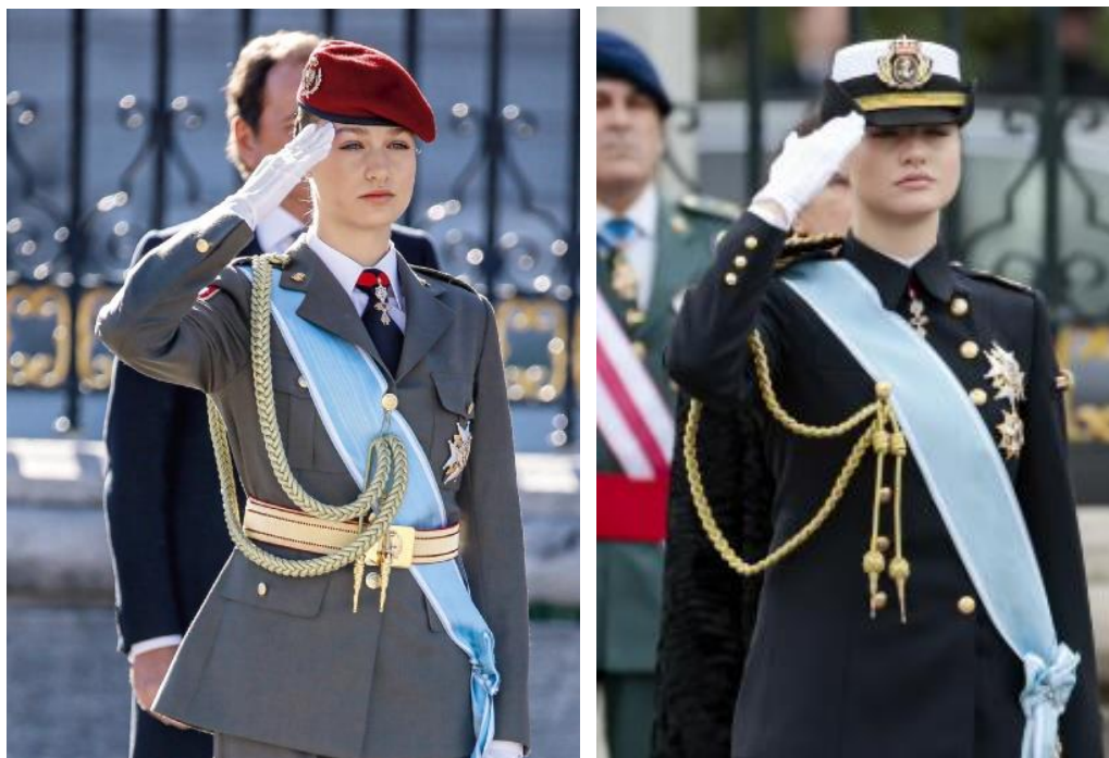
Fig. 11 y 12. Imagen de la Princesa de Asturias asistiendo a la Pascua Militar los años 2024 y 2025 luciendo las condecoraciones españolas citadas y los cordones comentadas

Para terminar este comentario vamos a hablar de los cordones que exhibe la Princesa en sus uniformes. En el Ejército de Tierra los alumnos en formación de la escala de oficiales llevan las llamadas cadeteras , un cordón trenzado que en su recorrido forma dos ramales con dos caídas que se sujetan a la hombrera izquierda y se unen junto a los botones de la guerrera. Están rematados por dos clavos metálicos. Son de color rojo para el uniforme de diario y dorado en los uniformes de gala y de época. Los de los futuros suboficiales son de color blanco. Se implantaron en la Ordenanza de 1762 como distintivo de los auxiliares del ejército. En 1875 se suprimieron, pero se recuperaron con el diseño actual en 1927 coincidiendo con la reapertura de la Academia General Militar. Lo mismo puede decirse de los cadetes del Ejército del Aire. En la Armada los cordones son siempre dorados y los guardiamarinas los llevan exclusivamente sobre el uniforme de gala. Además de los cadetes y guardiamarinas, llevan también cordones los gastadores (esos soldados escogidos por su altura y empaque que encabezan los desfiles), los agregados militares y los ayudantes de campo de los generales y de S. M. el Rey.