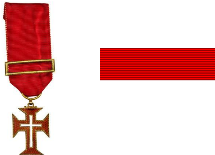
Fig. 6 y 7. Cruz y pasador de caballero/dama de la Orden Militar de Cristo de Portugal.