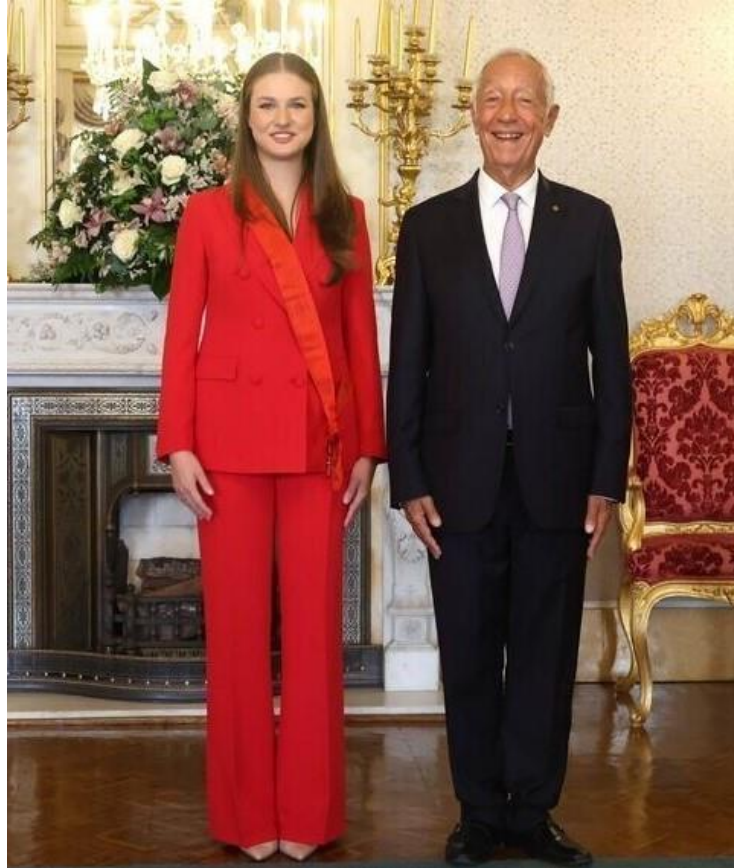
Fig. 5. S.A.R la Princesa de Asturias tras serle impuesta la Orden Militar de Cristo por el Presidente de la República del Portugal (12 de julio de 2024).

error falerístico, ya que el pasador mostrado no es el del grado de la condecoración otorgada, gran cruz, sino el de caballero/dama que es la categoría más modesta de la Orden de Cristo.