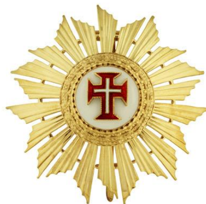
Fig. 8, 9 y 10. Pasador, banda y placa de la Gran Cruz de la Orden Militar de Cristo de Portugal.