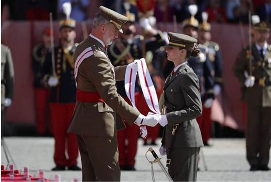
Fig. 2. S.M. el Rey impone la Gran Cruz del Mérito Militar a S.A.R. la Princesa de Asturias en la Academia General Militar de Zaragoza (28 de agosto de 2024).