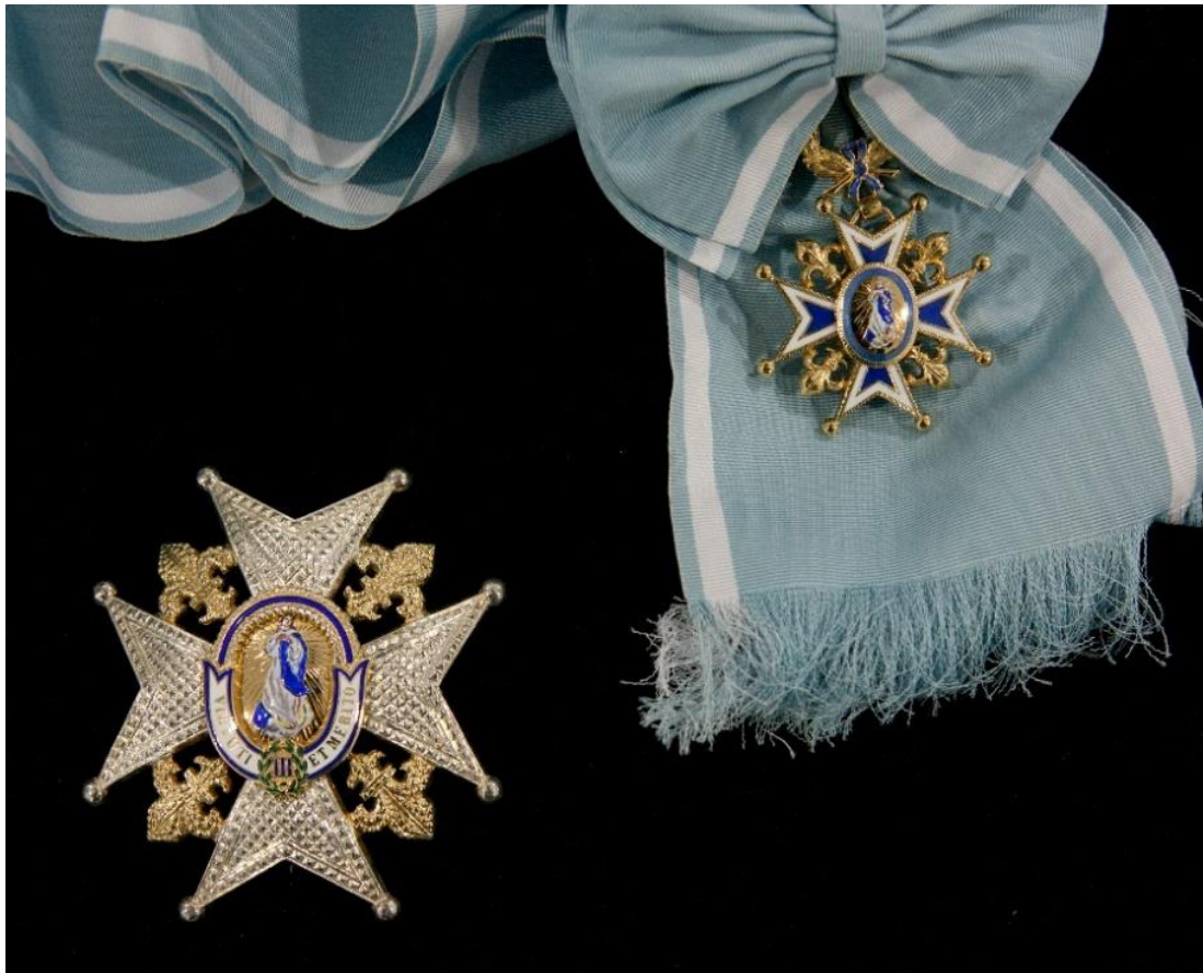
Fig. 1. De arriba abajo: pasador, collar, banda y placa del grado de collar de la Real y Distinguida Orden Española de Carlos III.

Tampoco contempla esta normativa pasador para el Collar de la Insigne Orden del Toisón de Oro, que Doña Leonor recibió de su padre el 30 de octubre de 2015 3 , una distinción que por su acrisolada antigüedad (1430) y prestigio es mucho más que una condecoración propiamente dicha. De hecho, en el Real Decreto de concesión se expresa con claridad su importancia para la Monarquía: “Continuando la secular tradición observada en la Casa Real española de otorgar e imponer las insignias de la Insigne Orden del Toisón de Oro a quienes están llamados a suceder en la Corona de España”.